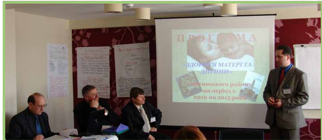
Тренінг для голів Координаційних рад, м. Київ, 3-4 березня 2010 р.