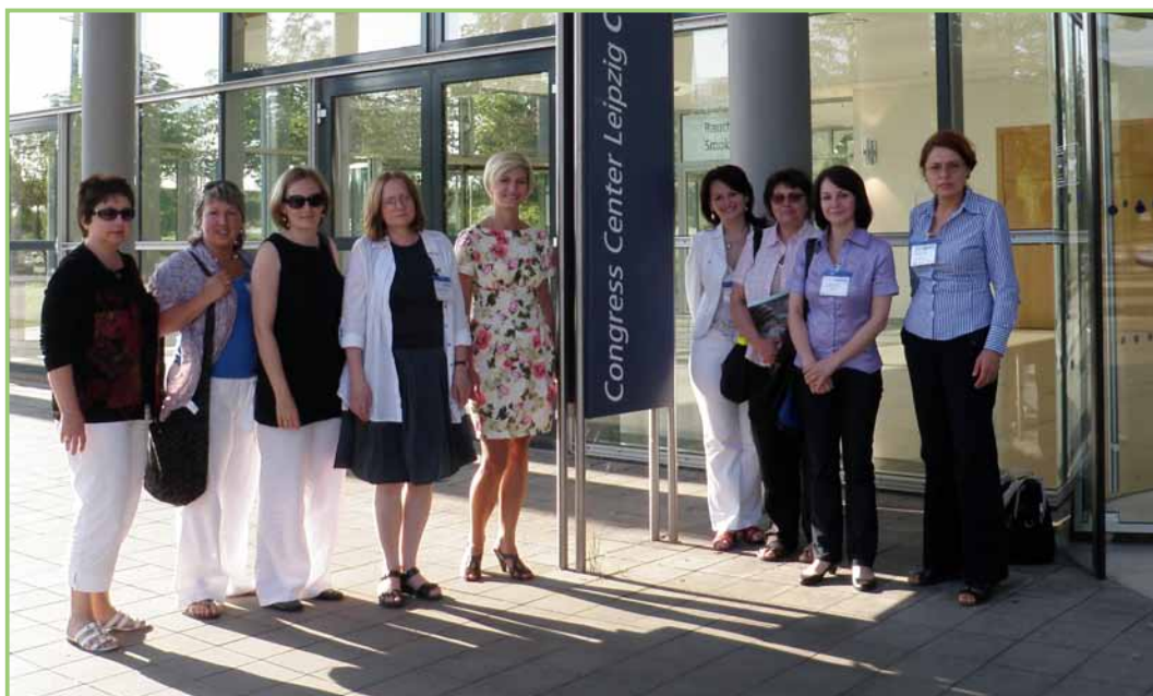
Учасники 12-го конгресу World Association for Infant Mental Health