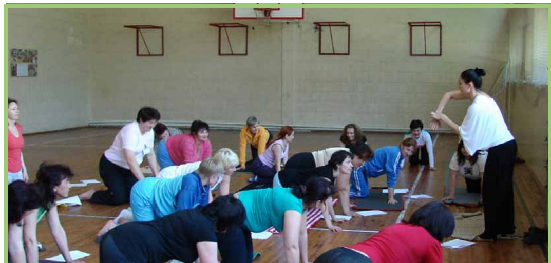
Тренінг «Методики роботи Шкіл відповідального батьківства», м. Київ, 25-27 березня 2010 р.