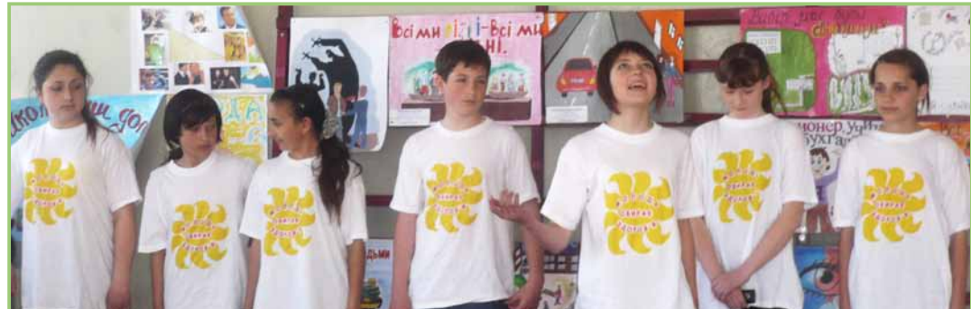
Конкурс плакатів у м. Новоазовськ.

Географія: Івано-Франківська обл. (м. Городенка, с. Вікно Городенківського р-ну, м. Рогатин, с. Чесники Рогатинського р-ну); Львівська обл. (м. Сокаль, с. Тартаків Сокальського р-ну, м. Дрогобич, с. Доброгостів Дрогобицького р-ну); АР Крим (смт. Кіровське, с. Журавки Кіровського р-ну, м. Білогорськ, с. Присівашине Советського р-ну); Донецька обл. (смт. Володарськ, с. Республіка Володарського р-ну, смт. Новоазовськ, с. Козацьке Новоазовського р-ну)