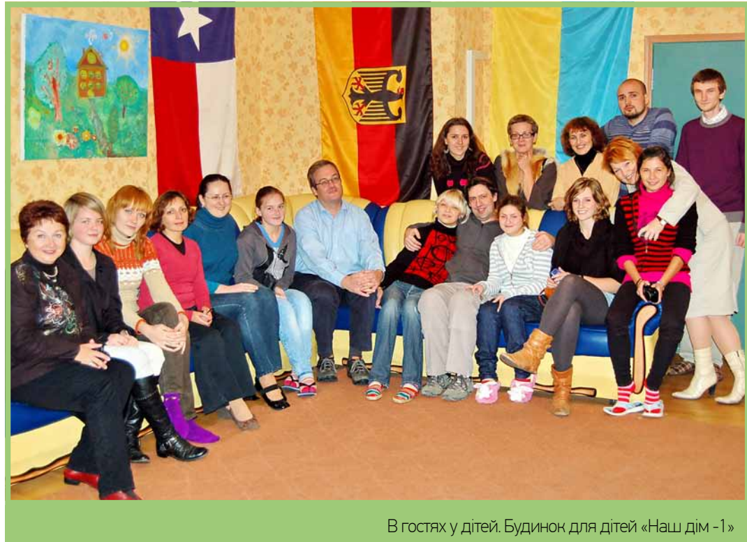
В гостях у дітей. Будинок для дітей «Наш дім -1»

ня у психологічному розвитку, і тепер вони відвідують звичайну школу. Результатом такої системи виховання є повна соціальна адаптація «державних» дітей, зокрема по закінченні школи вони вступають до вищих навчальних закладів. Один хлопчик став студентом київського політеху, кілька інших випускників – Кіровоградського державного педагогічного університету».