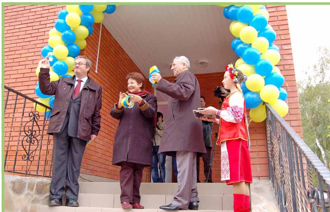
Церемонія відкриття будинку «Наш дім -2»

Не залишилась осторонь і громада міста. За ініціативи міської влади та самоврядування, а також силами місцевих бізнес структур для реалізації проекту було залучено понад півтора мільйона гривень , які пішли на оплату будівельних робіт та обладнання будинку.